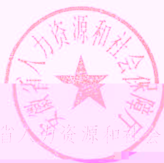
安徽省人力资源和社会保障厅