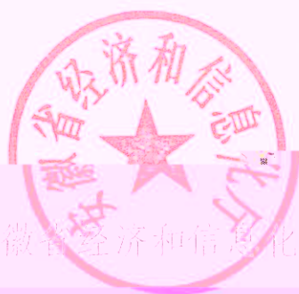
安徽省经济和信息化厅